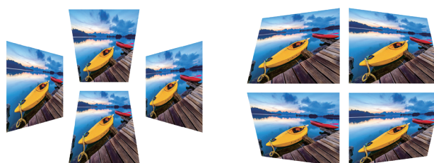
H/V Keystone: \pm 30^\circ

可支援垂直 / 水平梯形校正和四角幾何調整與畫面修正功能，免除安裝時產生畫面扭曲或失真的情形發生，真實呈現完美畫面內容。