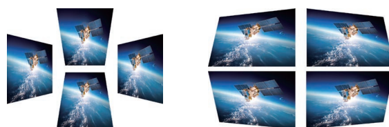
H/V Keystone: ±30°

可支援垂直 / 水平梯形校正和四角幾何調整與畫面修正功能，免除安裝時產生畫面扭曲或失真的情形發生，真實呈現完美畫面內容。